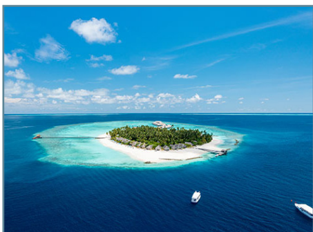
Atollo di Dhaalu